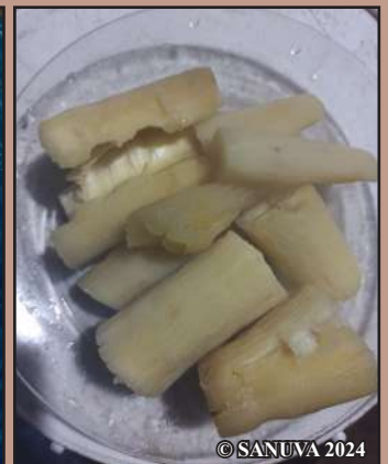
Le manioc et le poisson sont deux aliments sains