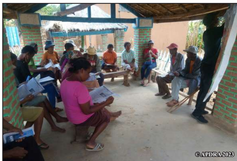
Réunion de l'association avec des mères et pères de famille

utilisé l'horloge journalière. Cela a généré la mise en place d'une réelle entraide dans les familles et des changements concrets dans le groupe dont je fais partie. Par exemple, la réorganisation des tâches a conduit les hommes à remplacer leurs femmes aux réunions de l'association lorsqu'elles ne sont pas disponibles. »